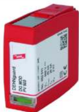
Fotografía no vinculante